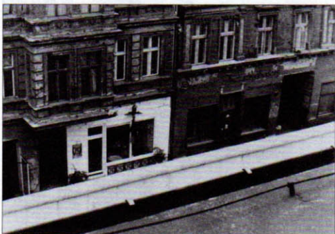
Abb. 8: Wall-StreetGallery, Zimmerstraße 12, Berlin (W.), Kreuzberg, 26.5.1987.

Das MfS kam zu folgender Einschätzung: »Die Öffentlichkeitswirksamkeit ist auf Grund der ört-